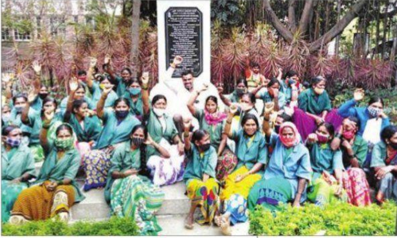
ಕಳೆದ ನಾಲ್ಕು ತಿಂಗಳಿಂದ ವೇತನ ಪಾವತಿ ಮಾಡಿಲ್ಲ ಎಂದು ಆರೋಪಿಸಿ ಯಲಹಂಕ ವಲಯದ ಬಿಬಿಎಂಪಿಯ ಗುತ್ತಿಗೆ ಪೌರ ಕಾರ್ಮಿಕರು ಪಾಲಿಕೆಯ ಕೇಂದ್ರ ಕಚೇರಿ ಮುಂದೆ ಬುಧವಾರ ಪ್ರತಿಭಟನೆ ನಡೆಸಿದರು.