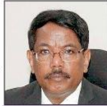
ಅಧಿಕಾರಿಗಳಿಗೆ ಬಿಬಿಎಂಪಿ ಆಯುಕ್ತರ ಸೂಚನೆ

"2009ರ ಸೆ. 29ಕ್ಕೆ ಮೊದಲು ಅನಧಿಕೃತವಾಗಿ ನಿರ್ಮಿಸಿರುವ ಧಾರ್ಮಿಕ ಕಟ್ಟಡಗಳ ಸಮೀಕ್ಷೆ ನಡೆಸಿ ವರದಿ ನೀಡಲು ನ್ಯಾಯಾಲಯ ಸೂಚಿಸಿದೆ. ಈ ಧಾರ್ಮಿಕ ಕಟ್ಟಡಗಳನ್ನು ಸ್ವಕಾಂತರ ಅಥವಾ ತೆರವುಗೊಳಿಸಬೇಕಿದೆ. 2009ರ ಸೆ. 29ರ ನಂತರ ಅಕ್ರಮವಾಗಿ ಧಾರ್ಮಿಕ ಕಟ್ಟಡಗಳನ್ನು ನಿರ್ಮಿಸಲು ಅವಕಾಶವಿಲ್ಲ. ಅಂಥ ಕಟ್ಟಡಗಳನ್ನು ತೆರವು ಮಾಡಲು ಕೋರ್ಟ್ ಆದೇಶಿಸಿದೆ," ಎಂದು ತಿಳಿಸಿದರು.