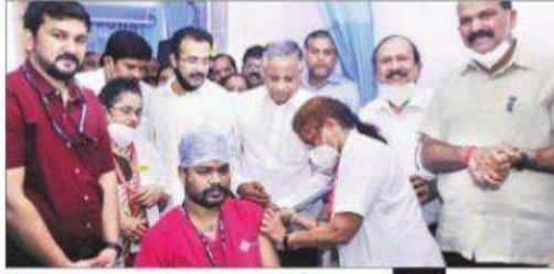
ಬೆಂಗಳೂರಿನಲ್ಲಿ ಈವರೆಗೆ ಲಸಿಕೆ ಪಡೆದವರ ವಿವರ

ಲಸಿಕೆ ಪಡೆದವರ ಪೈಕಿ 1,095 ಸರ್ಕಾರಿ ಮತ್ತು ಬಿಬಿಎಂಪಿಯ ಆರೋಗ್ಯ ಕಾರ್ಯಕರ್ತರು, 2,708 ಖಾಸಗಿ ಆಸ್ಪತ್ರೆಯ ಆರೋಗ್ಯ ಸಿಬ್ಬಂದಿ ಎಂದು ಬಿಬಿಎಂಪಿ ಮಾಹಿತಿ ನೀಡಿದೆ.