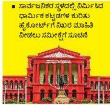
■ ಸಾರ್ವಜನಿಕ ಸ್ಥಳದಲ್ಲಿ ನಿರ್ಮಿಸಿದ ಧಾರ್ಮಿಕ ಕಟ್ಟಡಗಳ ಕುರಿತು ಹೈಕೋರ್ಟ್‌ಗೆ ನಿಖರ ಮಾಹಿತಿ ನೀಡಲು ಸಮೀಕ್ಷೆಗೆ ಸೂಚನೆ

ಬಿಬಿಎಂಪಿಯ ವ್ಯಾಪ್ತಿಯಲ್ಲಿ ಅನಧಿಕೃತವಾಗಿ ಧಾರ್ಮಿಕ ಕಟ್ಟಡ ನಿರ್ಮಾಣ ಮಾಡಿರುವ ಸಂಬಂಧ ಬುಧವಾರ ವಿಶೇಷ ಆಯುಕ್ತರು, ಜಂಟಿ ಆಯುಕ್ತರು ಹಾಗೂ ಇತರ ಅಧಿಕಾರಿಗಳೊಂದಿಗೆ ಸಭೆ ನಡೆಸಿದ ಬಳಿಕ ಮಾತನಾಡಿದ ಆಯುಕ್ತರು, ಸಾರ್ವಜನಿಕ ಸ್ಥಳಗಳಲ್ಲಿ ಅನಧಿಕೃತ ಧಾರ್ಮಿಕ ಕಟ್ಟಡಗಳನ್ನು ನಿರ್ಮಿಸುವಂತಿಲ್ಲ ಎಂದು ಸುಪ್ರೀಂ ಕೋರ್ಟ್ 2009ರಲ್ಲಿಯೇ ಆದೇಶ ಮಾಡಿದೆ. ನಗರದಲ್ಲಿ ಅನಧಿಕೃತವಾಗಿ ಧಾರ್ಮಿಕ ಕಟ್ಟಡ