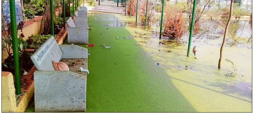
ಕಲುಷಿತಗೊಂಡಿರುವ ಕನ್ನಡಿ ಕೆರೆ

ಕಲ್ಯಾಣಿ ನಿರ್ಮಾಣ: ಹಲವು ವರ್ಷಗಳ ಹಿಂದೆ ಮಳೆಯಿಲ್ಲದೆ ಕೆರೆ ಸಂಪೂರ್ಣವಾಗಿ ಬತ್ತಿಹೋಗಿತ್ತು. ಜಲಚರಗಳಿಗೆ, ಪಕ್ಷಿಗಳಿಗೆ, ಜಾನುವಾರುಗಳಿಗೆ ಕುಡಿಯುವ ನೀರನ್ನು ಸಮಸ್ಯೆಯಾದಾಗ ಶ್ರೀವೀರಭದ್ರಸ್ವಾಮಿ ವೀರಶೈವ ನಿತ್ಯಾ